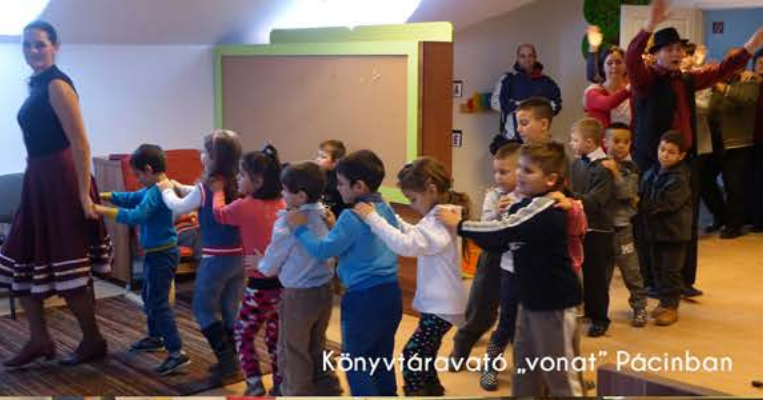
Könyvtárvonató „vonat” Páciban

Te is lehetsz győztes! - tehetségkutató roma gyerekeknek