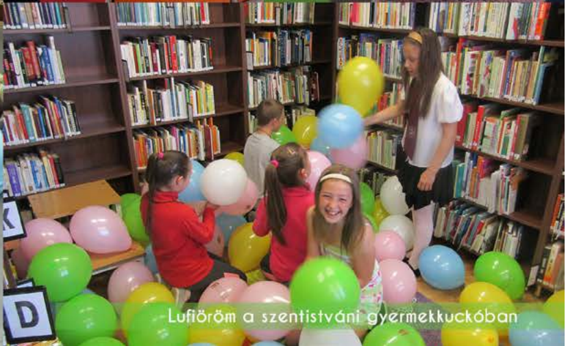
Lufiöröm a szentistváni gyerekkuckóban