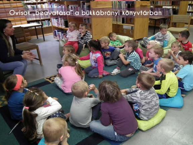
Ovisok „beavatása” a bükkábrányi könyvtárban