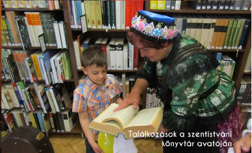
Találkozások a szentistváni könyvtár avatóján