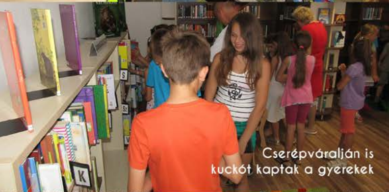
Cserépváralján is kuckót kaptak a gyerekek