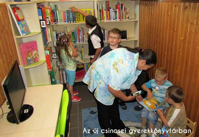
Az új csínesei gyerekkönyvtárban