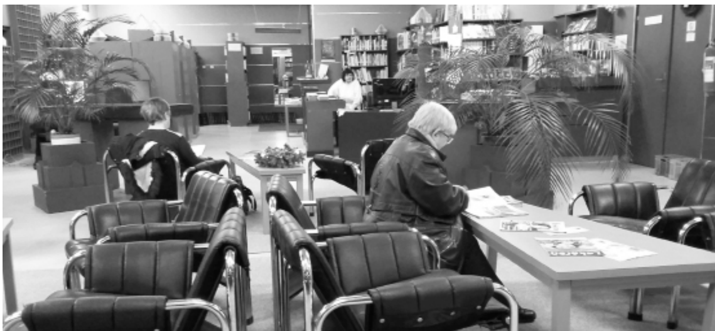
Egy kassai lakótelepi fiókkönyvtárban

zéssel látják el. A helyi kollégák szerint ezáltal növekedett a színvonalas művek kölcsönzési aránya.