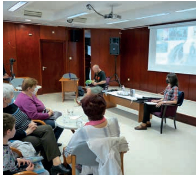
PubliCafe: „A szamaras zarándok”

Rendezvényeik népszerűségét mi sem bizonyítja jobban, mint az a 2019-ben elvégzett partnerelégedettségi felmérés, melynek során az intézmény azt a visszajelzést kapta, hogy a könyvtár több ponton csatlakozhatna a tantervhez, hozzájárulhatna a tanórák színesebbé tételéhez.