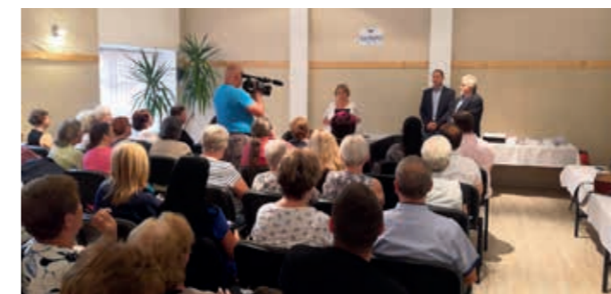
Ünnepi könyvhét | Szikszó

A miskolci programok mellett Borsod-Abaúj-Zemplén megye számos települése csatlakozott a könyvheti programokhoz. Összeállításunkban Abaúj, Borsod és Zemplén egy-egy településeinek programjait idézzük fel.