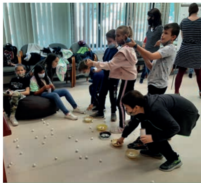
Királylány a lángpalotában című foglalkozás