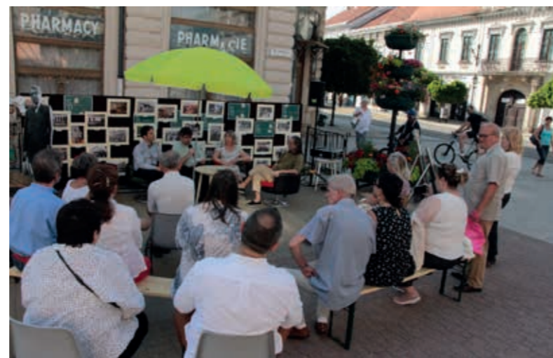
Ünnepi könyvhét | Miskolc

Miskolcon a program szervezője – a város támogatásával – a II. Rákóczi Ferenc Megyei és Városi Könyvtár, szoros együttműködésben a téren megjelenő könyvkereskedőkkel, kiadókkal.