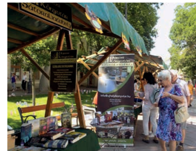
Ünnepi könyvhét | Sátoraljaújhely