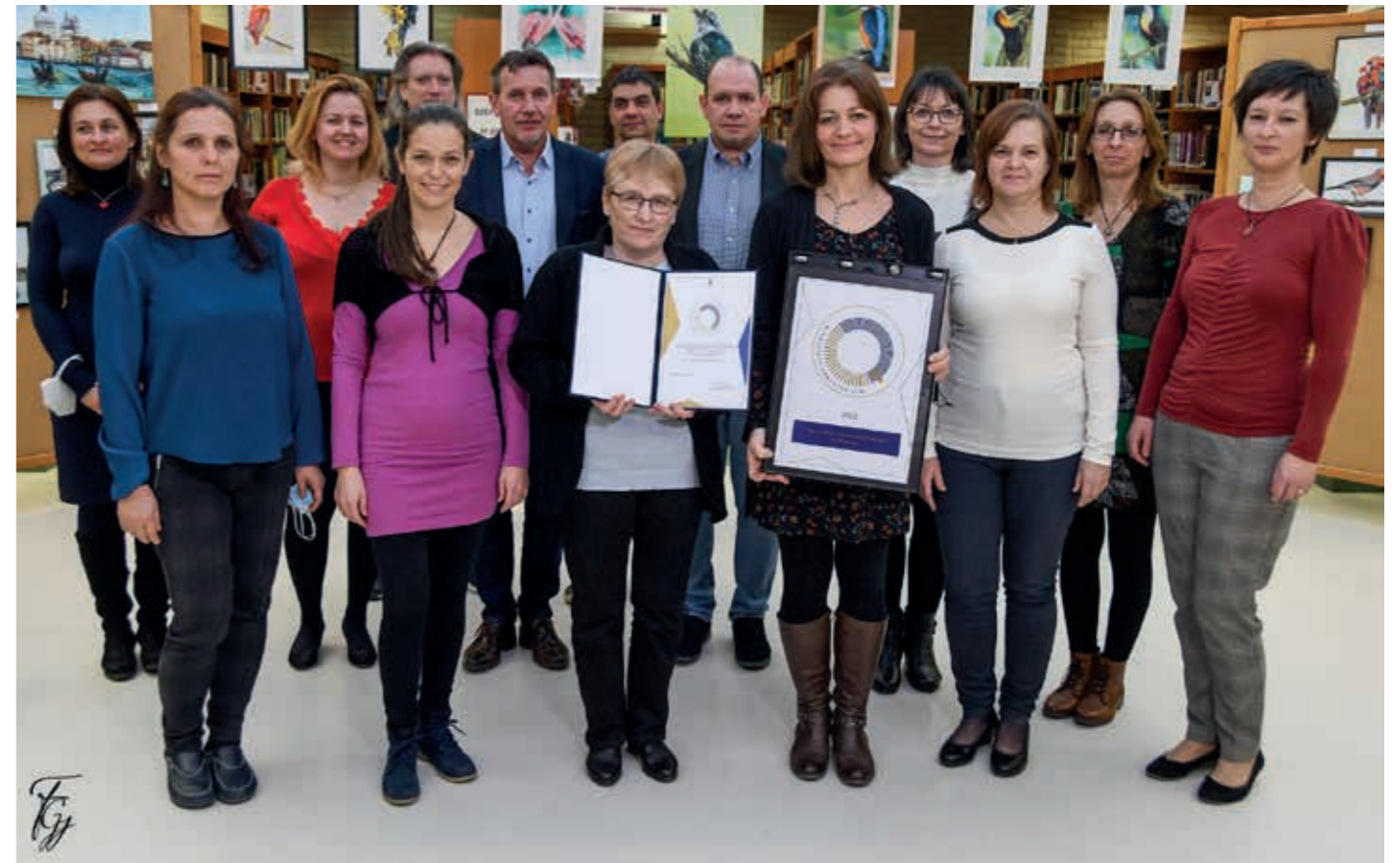
A csapat az oklevéllel a polgármester társaságában

A könyvtár jó kapcsolatot ápol a nevelési, oktatási intézményekkel, az óvodákkal, az általános és középiskolákkal is. A könyvtári dolgozók munkája eredményeként egy teljesen átdolgozott, óvodai és iskolai csoportoknak szánt kínálat áll a különböző intézmények rendelkezésére. A kiállításokhoz interaktív foglalkozásokat kapcsolnak, oktatást segítő e-tananyagokat készítettek, valamint bekapcsolódtak a köznevelési témahetek programjaiba is. A köznevelési intézmények számára tájékoztatásul elkészítettek Lyukasóra: könyvtári foglalkozásajánló című kiadványukat, amelyet folyamatosan frissítenek.